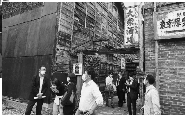
一步足を踏み入れば別世界。 レトロな雰囲気圧迫される