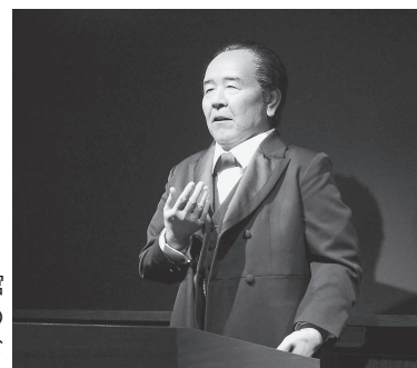
渋沢栄一記念館 (深谷市)の 渋沢栄一アンドロイド