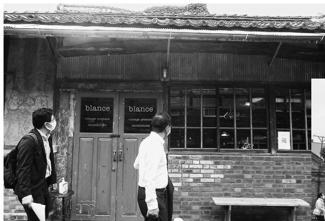
敷地内にはビンテージショップや 珈琲焙煎店、ギャラリーが並ぶ