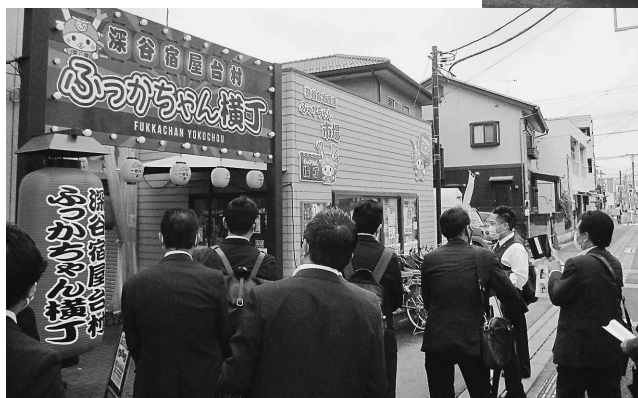
地産地消の屋台や直売所が並び 市民で賑わう「ふっかちゃん横丁」