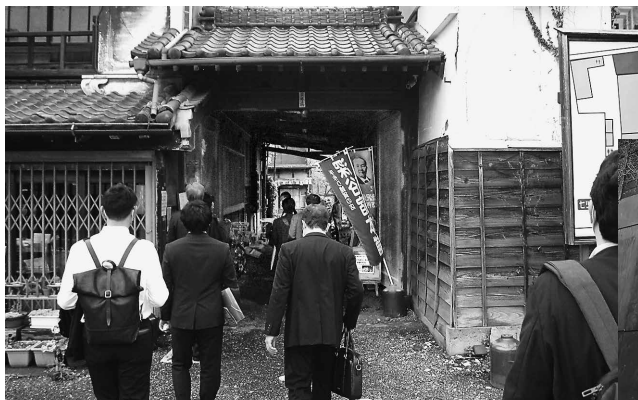
江戸時代から約300年続いた 酒造所「七ツ梅酒造」跡