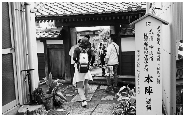
中山道最大規模の宿場だった 深谷宿の本陣遺構を訪ねる

現地見学会を通じて、まちづくりを肌で感じたほか、ディスカッションでは「理想のまちづくり・地域活性化／中小不動産業者ならではの地域活性化」をテーマに、各チームで意見交換を行いました。まちづくりを進めていくことに必要なこととして、「地域に埋もれた財産に付加価値をつけることで、まちのシンボルとなる店や物を作ること」や「不動産業者と市民が丸となり協力していくこと」などが挙げられ、まちづくりのあり方について熱い議論が交わされました。