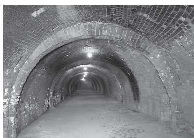
煉瓦が製造されていた ホフマン輪窯6号窯