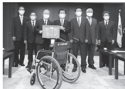
奥ノ木市長（左から3人目）より感謝状をいただきました

同支部では、地域貢献活動の一環として、積極的に毎年このような活動を継続しています。