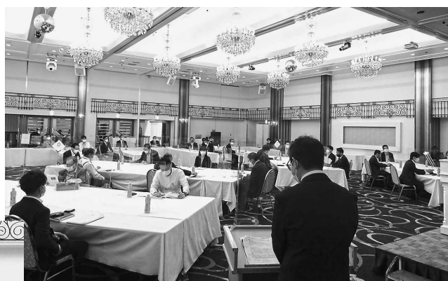
感染対策を徹底しながらも、 熱い議論が展開されました