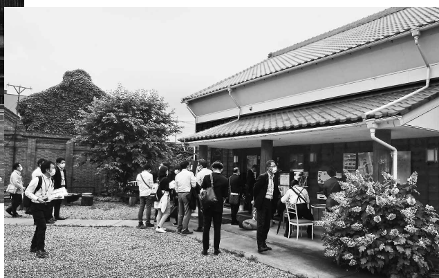
蔵を改装したミニシアター 「深谷シネマ」