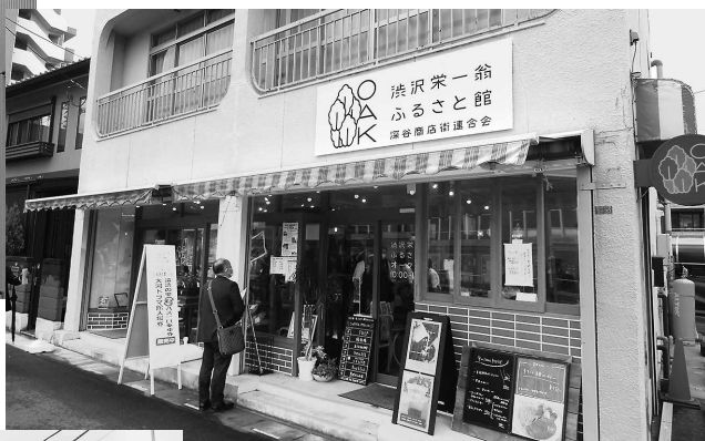
シェアカフェ「渋沢栄一翁 ふるさと館」。日替わりで シェフが腕を振るう