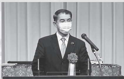
衆議院議員 柴山昌彦様