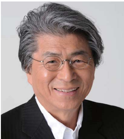
ジャーナリスト 鳥越 俊太郎様