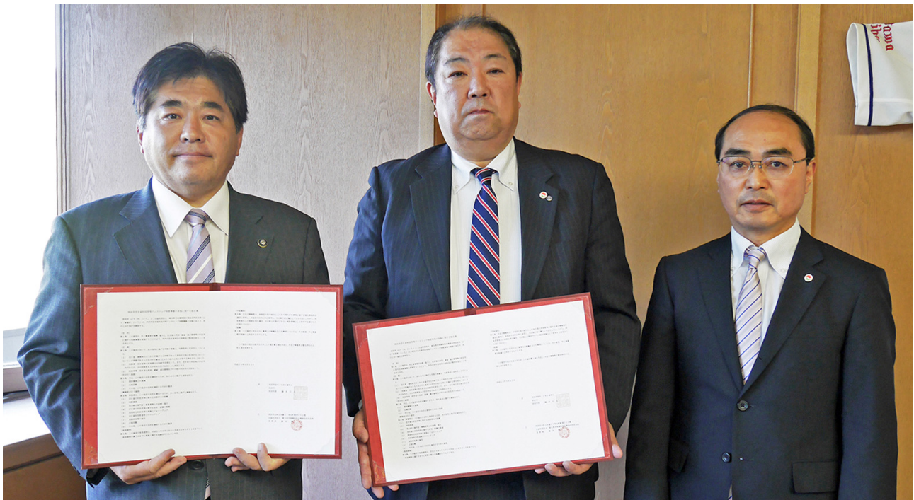
左から藤本市長、藤永所沢支部長、内山会長

本会（公益社団法人埼玉県宅地建物取引業協会）は、平成29年5月22日(月)午後3時30分に所沢市役所 高層棟3階市長応接室（所沢市並木一丁目1番地1）において、所沢市の藤本正人市長と『所沢市空き家利活用等ワンストップ相談事業の実施に関する協定』の調印式を行いました。