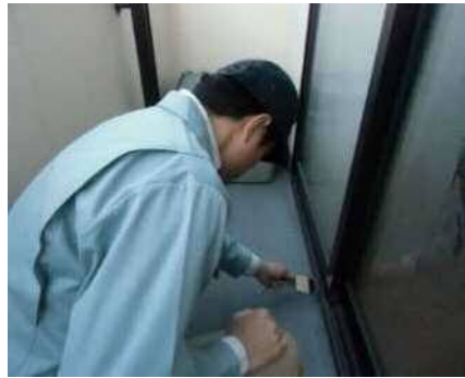
「外部（バルコニー）」調査の様子