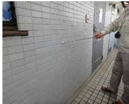
「外部（外壁）」調査の様子