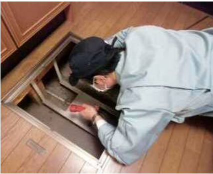
「土台・床組、基礎」調査の様子