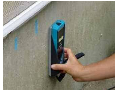
「基礎配筋」の調査機器