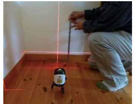
「床の傾きを計測する」調査機器