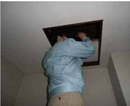
「小屋組・梁」調査の様子