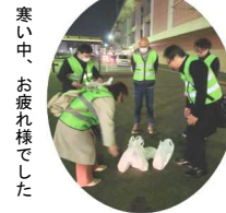
寒い中、 お疲れ様でした