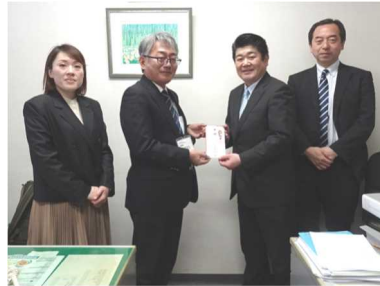
蕨市社会福祉協議会