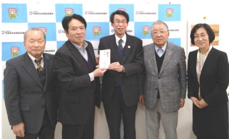
戸田市社会福祉協議会