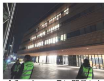
令和5年10月に開業した 新庁舎周辺もパトロール