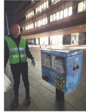
武山新青年部長 蕨市新庁舎を背景に