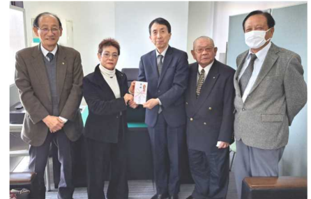
川口市社会福祉協議会

令和6年3月、南彩支部の役員が、川口・蕨・戸田市社会福祉協議会を訪問し、チャリティ事業にて集まった募金を寄贈して参りました。それぞれに33,000円の寄付金となりました。会員皆様のご協力誠にありがとうございました。