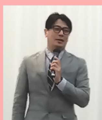
佐々木氏による特別講演